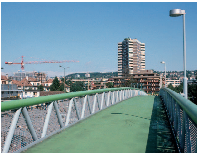
Passerelle: Verbindungsweg vom S-Bahnhof Altstetten in die Grünau