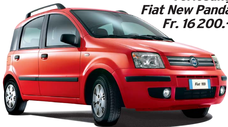
Verlosung Fiat New Panda Fr. 16 200.-